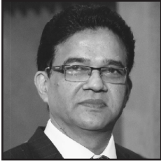
संपादक व प्रकाशक संजय चोरडिया