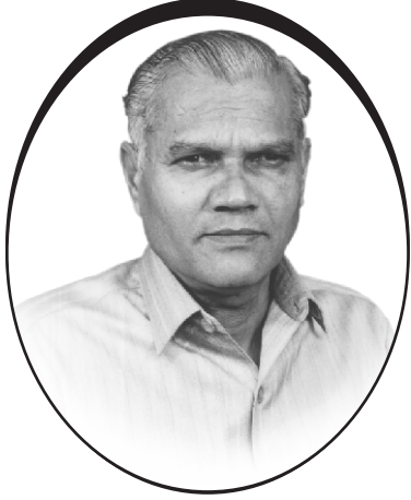
जैन जागृतिचे संस्थापक